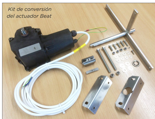
Kit de conversión del actuador Beat

El Beat se conectará a las máquinas de la misma manera que lo hace el actuador actual, con el mismo enchufe; girará dentro de los 15 segundos, para que los controles no tengan problemas con la configuración de temporización, de 50 o 60 Hz. El actuador Beat requiere un sencillo kit para cada carrito para la conexión mecánica al carrito.