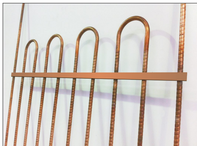
Kit de Actualización SL150 (10 Columnas)