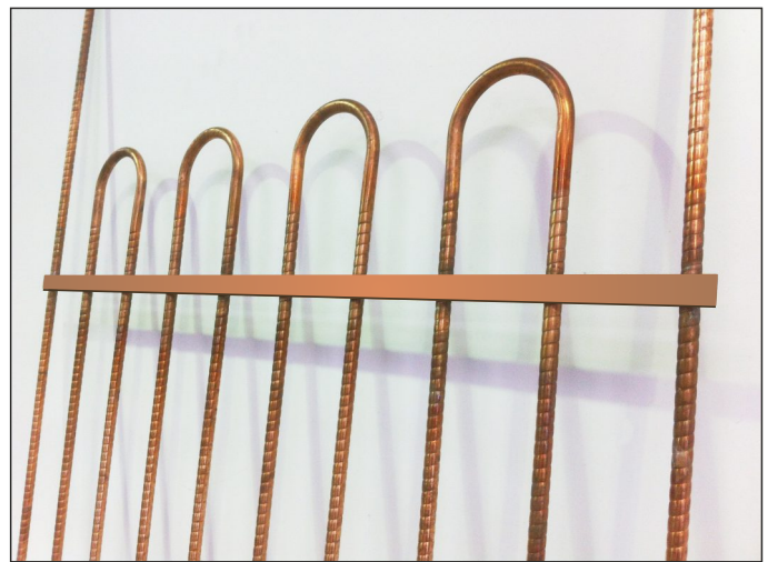
Kit de Actualización SL150 (10 Columnas)