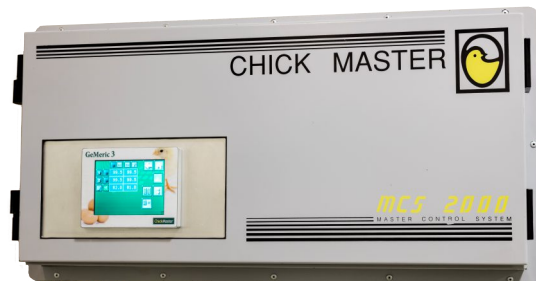
GeMeriC 3 instalado en el gabinete de control existente