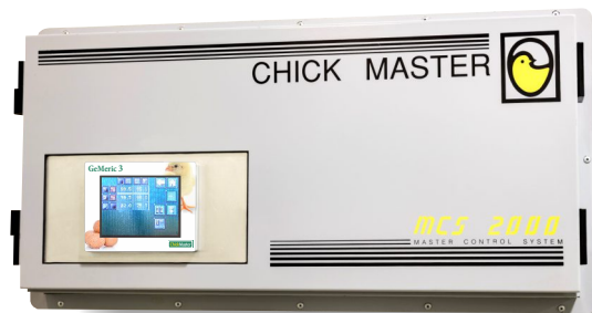
GeMeric 3 instalado en el gabinete de control existente